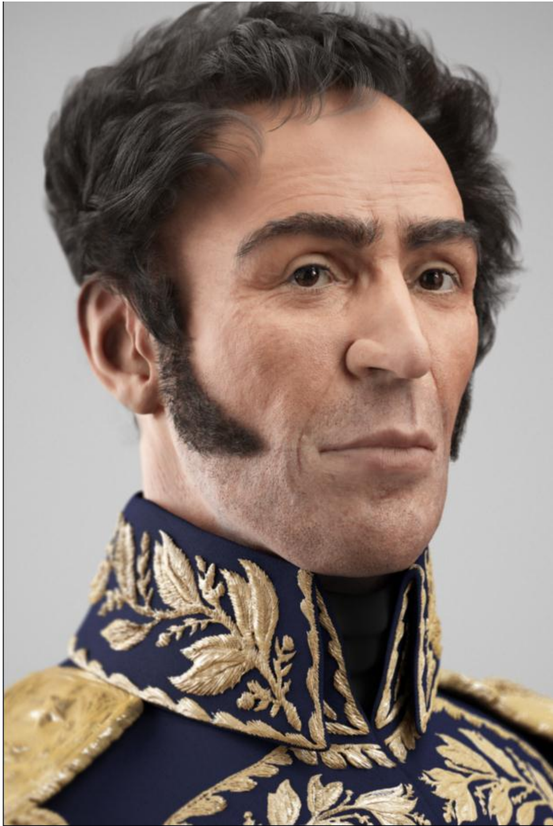
Reconstrucción facial 3D de El Libertador Simón Bolívar. Vista Perfil 2