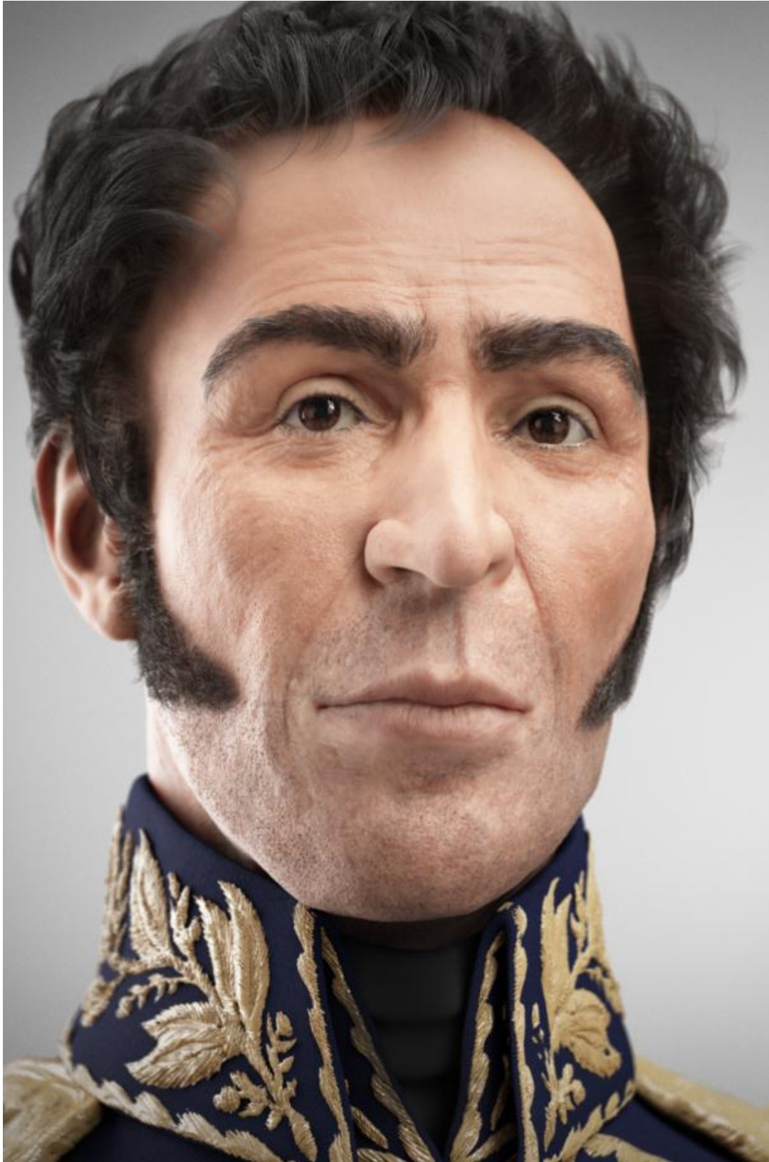
Reconstrucción facial 3D de El Libertador Simón Bolívar. Vista Frontal.