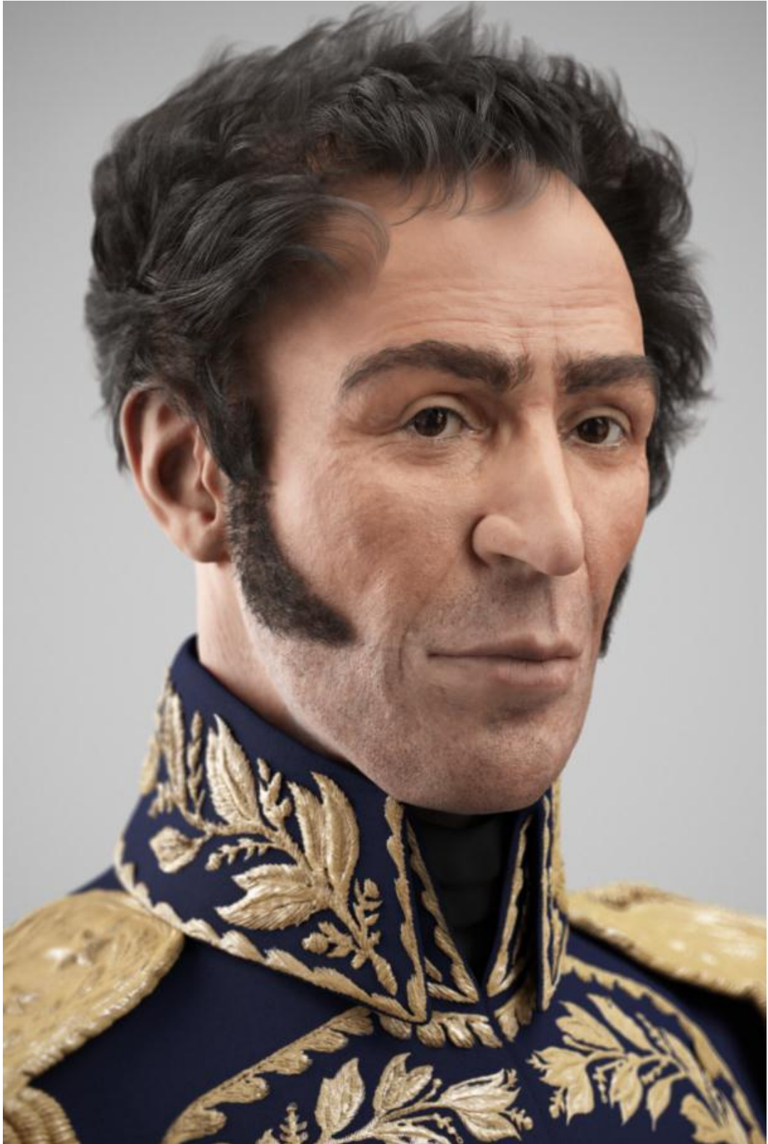
Reconstrucción facial 3D de El Libertador Simón Bolívar. Vista Perfil 1